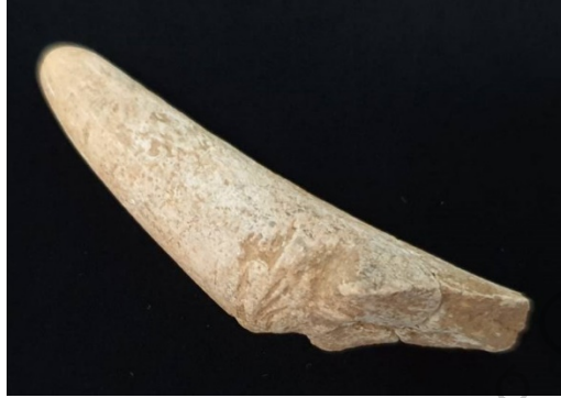
รูปที่ 1 Sample 10 ชิ้นส่วนเขา

แหล่งที่พบ: พบบริเวณหน้าถ้ำ ในเขตพื้นที่ ม.บูกะตยามู ต.ควนโดน อ.ควนโดน จ.สตูล